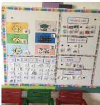
Figura 2.1. Kalendari vjetor Figura 2.2. Qendra e shkencës