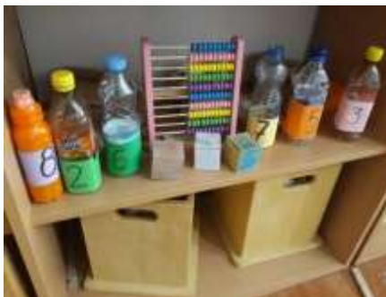
Foto të realizuara nga studentët gjatë punës praktike në institucionet parashkollore dhe klasat përgatitore

Fotot nga fig.2 na tregojnë punën e studentëve edukatorë, të cilët kanë planifikuar dhe realizuar aktivitete në lëndë të ndryshme me fëmijë gjatë punës praktike. Fotoja e parë (2.1) paraqet aktivitetin rutinë ditore, të cilin e realizojnë çdo ditë me qëllimin e të mbajturit mend dhe rikujtimin e informacioneve të nevojshme duke filluar nga ditët e javës, muajt e vitit, stinët, motin dhe datat. Fotoja e dytë (2.2) paraqet punën e fëmijëve në grupe në qendrën e shkencës ku me anë të mjeteve, ngjyrave e formave të ndryshme arrijnë të jenë kreativë në punën e tyre bashkëpunuese. Fotoja e tretë (2.3) paraqet ndërtimin e urës nëpërmjet mjeteve ricikluese në lëndën e gjuhës angleze ku fëmijët komunikojnë mes vete dhe me edukatoren duke mësuar për mjetet e nevojshme të punës, materialet ndërtimore, rëndësinë e urës, gjatësinë dhe lartësinë e saj, si dhe informacione të tjera me rëndësi; ndërsa fotoja e katërt (2.4) paraqet qendrën e matematikës ku janë përgatitur mjetet e konkretizimit që shërbejnë në mbajtjen mend të numrave, ngjyrave, formave gjeometrike, materialeve etj. Të gjitha aktivitetet e realizuara në qendrat e ndryshme i ndihmojnë fëmijët të shohin, të prekin, të mendojnë, të rikujtojnë, të